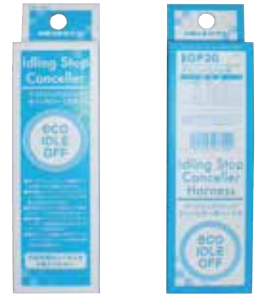
EG-1525 アイドリングストップ キャンセラー 本体 EGP21~32 車種別 ハーネス